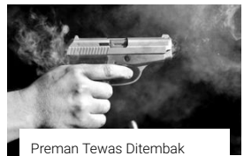
Preman Tewas Ditembak Setelah Palak Truk, Sopirnya Ternyata Polisi