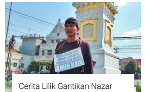
Cerita Lilik Gantikan Nazar Amien Rais, Idolakan Wayang Sengkuni hingga Hati Geram

Penulis : Yohanes Enggar Harususilo Editor : Yohanes Enggar Harususilo