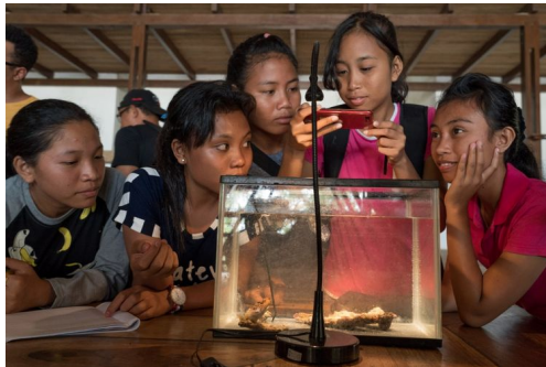
No-Trash Triangle Initiative bermitra dengan Seasoldier mengembangkan program pendidikan konservasi laut inovatif yang diluncurkan pada 27 Juli 2019 di Pulau Bangka, Sulawesi Utara.

Selain pendidikan, "No-Trash Triangle Initiative" juga mendukung penelitian dan inovasi ilmiah, memimpin program pengumpulan limbah yang hingga hari ini, mengirim lebih dari 500 kantong plastik dari laut untuk didaur ulang dan mendorong tanggung jawab perusahaan di Eropa dan Indonesia.