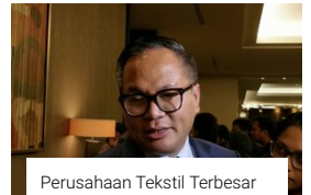
Perusahaan Tekstil Terbesar Indonesia Gagal Bayar Bunga Obligasi, Bank Mandiri Kaget

Lulusan ISP dan Upaya Menularkan Pembelajaran Inovatif Menyenangkan