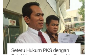
Seteru Hukum PKS dengan Fahri Hamzah yang Semakin Merunging...