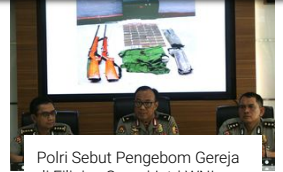
Polri Sebut Pengebom Gereja di Filipina Suami-Istri WNI