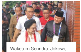
Waketum Gerindra: Jokowi, Prabowo, dan Megawati Bertemu Besok Siang